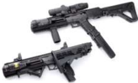
Hera Arms Triarii