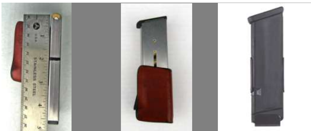
Metodo di misurazione