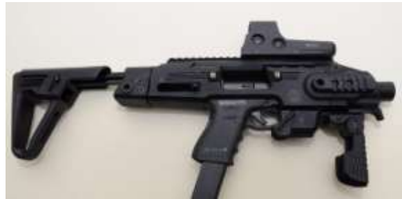
CAA Tactical RONI